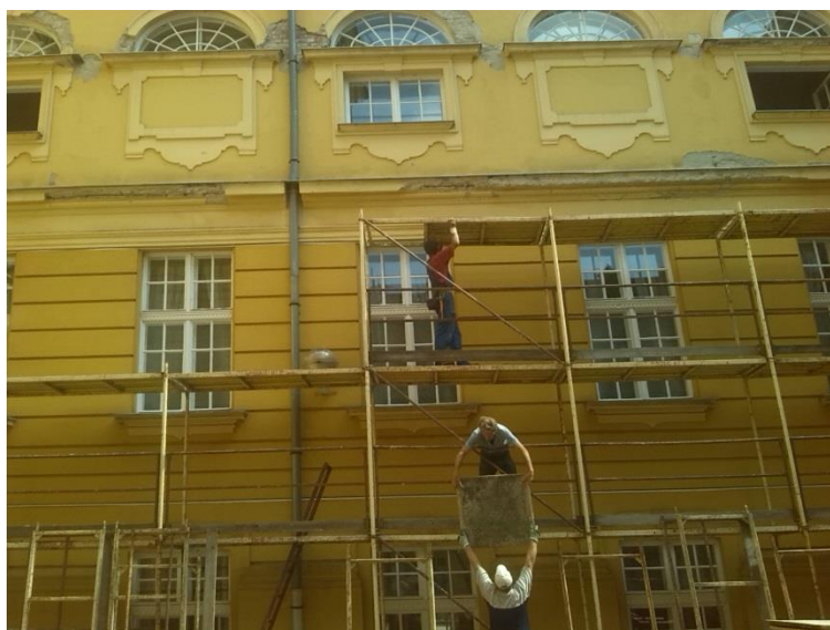
Készül az állványzat