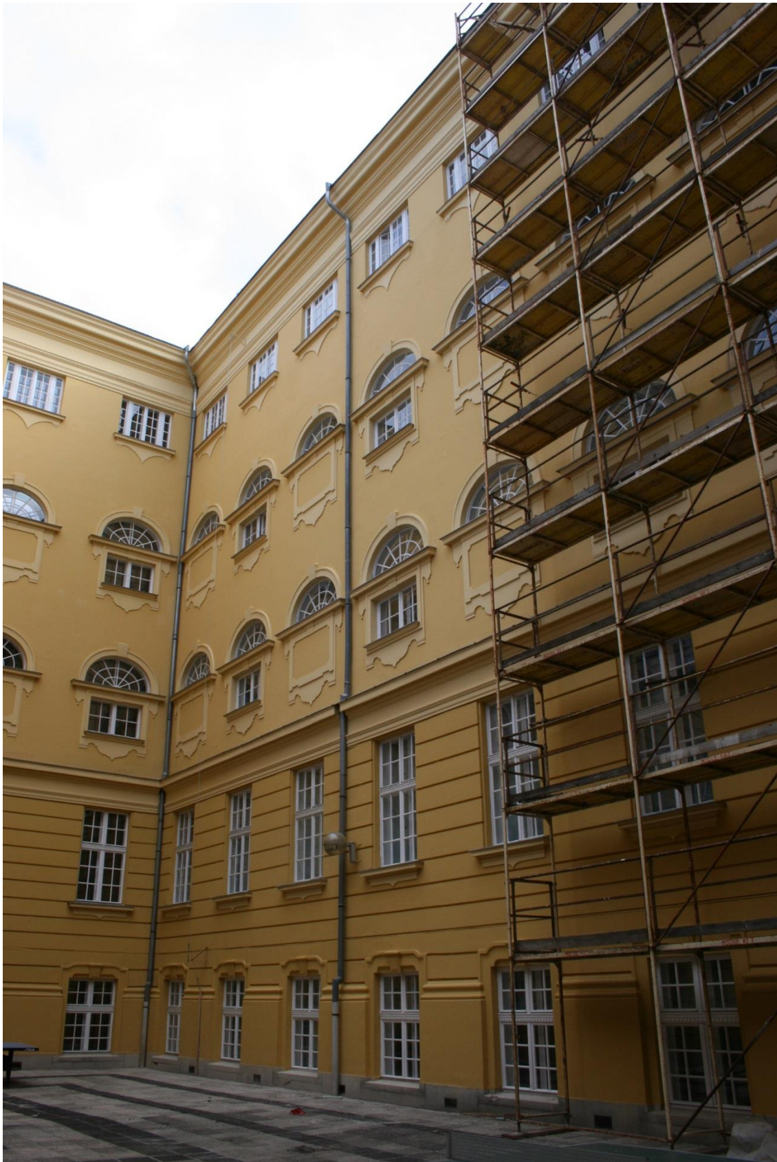
Már elkészült, megújult falszakasz