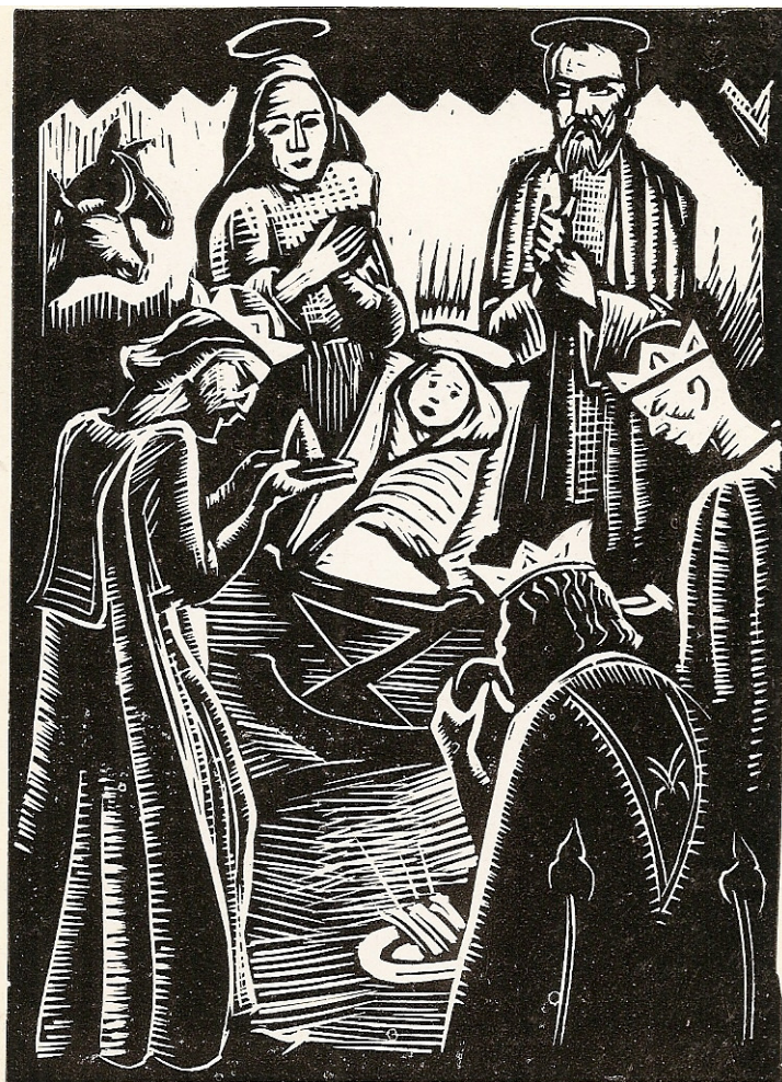
Nagy Nándor fametszete