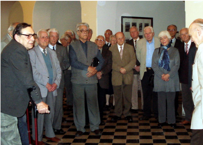
A résztvevők egy csoportja