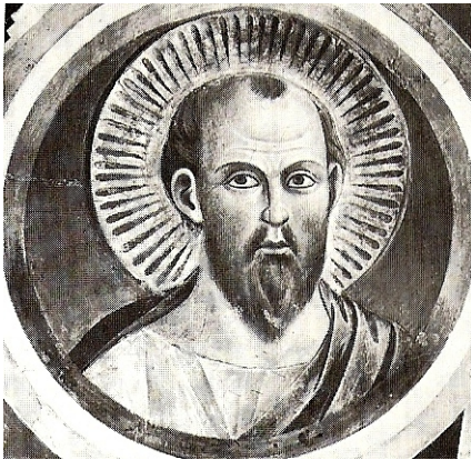
Szent Pál képe az Assisi-beli Szt. Ferenc bazilika freskóján, Giotto körének alkotása. (13.század)

kenységével nemcsak az evangéliumot hirdette, hanem bizonyosságát adta mindannak, ami akkor megtörtént. A személyek történelmileg hitelesek, az események igazak, más forrásokból is igazoltak.