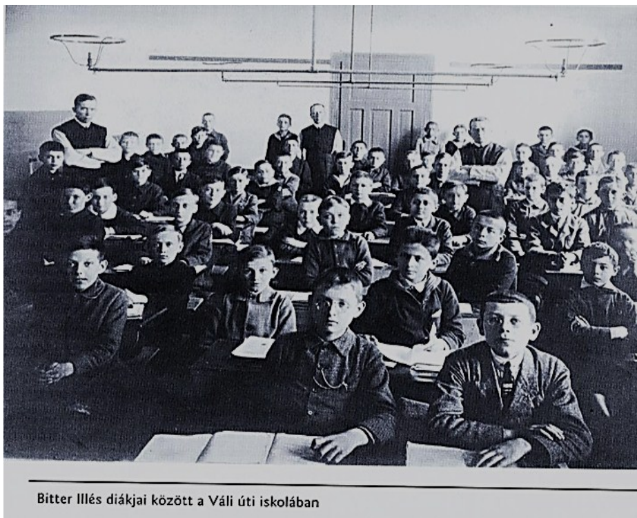
Bitter Illés diákjai között a Váli úti iskolában

Az iskolaalapítás örvendetes eseményeit azzal fejeztük be előző számunkban, hogy „szeptember 7-én megkezdődött a munka hétköznapja...”