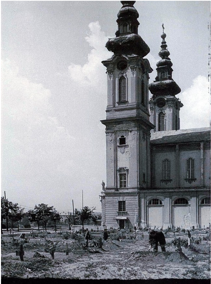
Egy ciszterci diák hányattatásai 1944-45-ben, a háború utolsó két évében